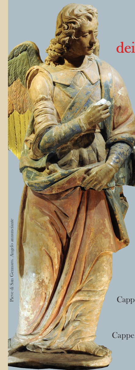
Pieve di San Genaro. Angelo annunciante

Domenica 30 Dicembre alle ore 15,00 Canti Natalizi alla Cappella Santini della Villa Torrigiani con «Schola Cantorum di Saione» (Arezzo). Seguirà concerto alla Chiesa Parrocchiale insieme alla corale Giacomo Puccini di Camigliano.